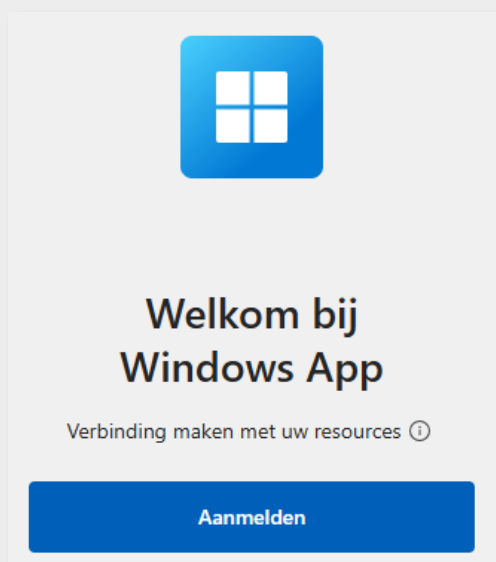
Inlogscherm van Windows app (Desktop)