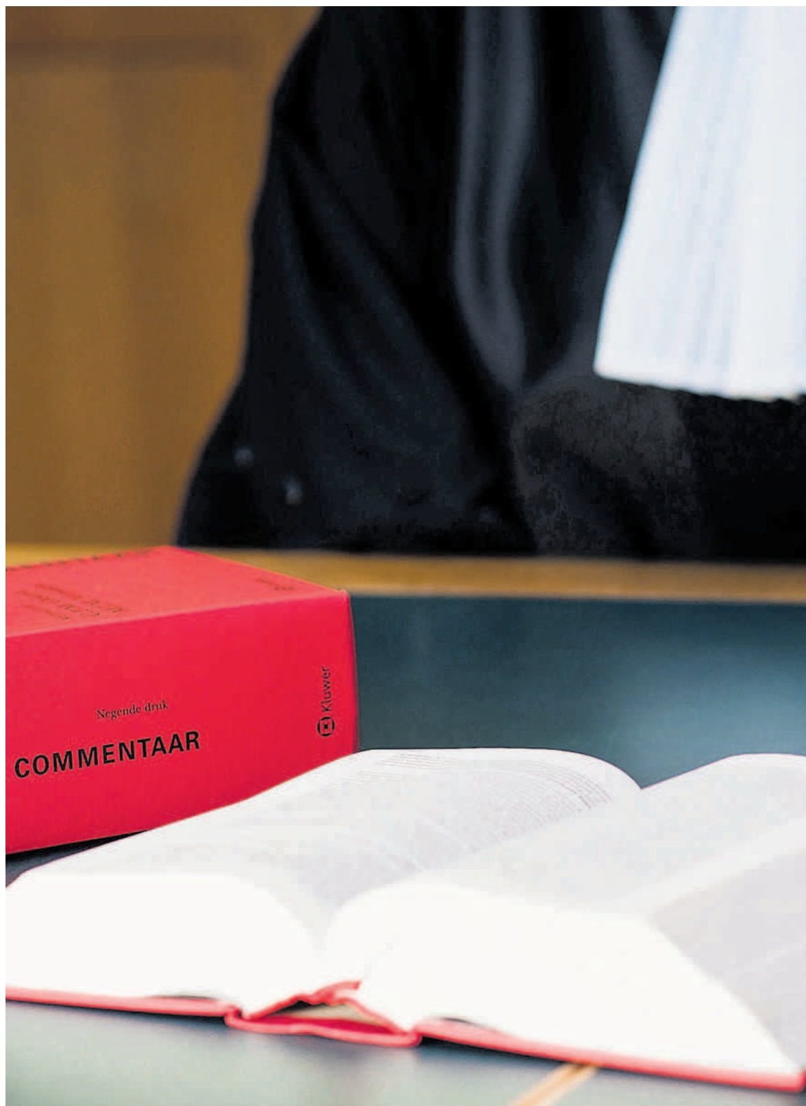
De rechtspraak moet beseffen dat een andere vorm van weten bestaat, die ons dichterbij de mens brengt.

Het is verrassend, hoe open Slootweg de wereld van religie en theologie betreedt. Kerkvader Augustinus is al genoemd, maar ook Blaise Pascal en de orthodox-protestantse theoloog Willem Aalders komen ter sprake. En ook de beruchte filosoof Friedrich Nietzsche voegt zich bij het gezelschap. Die laatste, Nietzsche, hoe moeten we die plaatsen tussen al die religieuze denkers en schrijvers? Het antwoord op die vraag staat niet los van de persoonlijke ontwikkeling van Slootweg, als katholiek en intellectueel, vertelt hij.