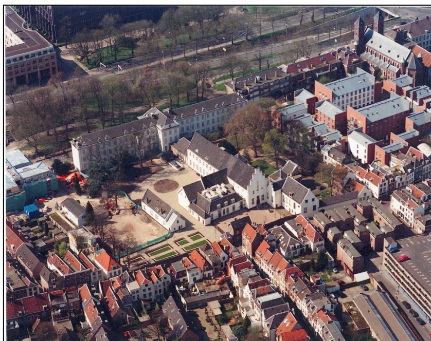
Het Duitse Huis, sinds 1346 gevestigd binnen de wallen, aan de Sprinweg