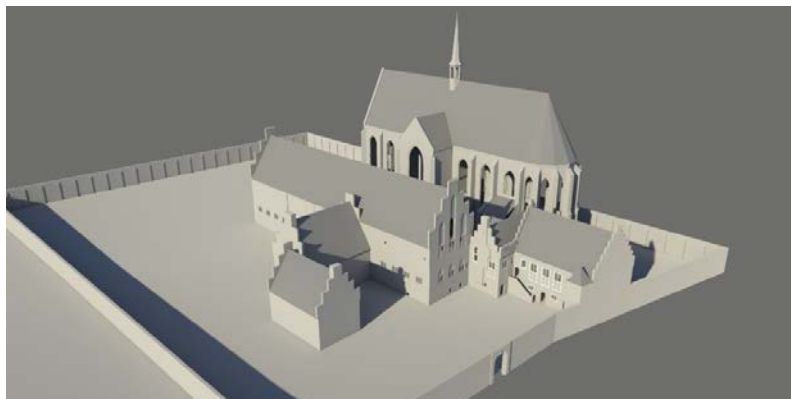
3-D reconstructie van het middeleeuwse Duitse Huis aan de Springweg

Essentieel voor dit onderdeel is het bijeenbrengen en analyseren van archivalische documentatie over schenking, aankoop en verkoop. Verder kan een poging gedaan worden om via 'Besitzrückschreibung', vertrekkend vanuit het kadaster van 1832, delen van de bezitscomplexen van de Duitse Orde precies in kaart te brengen. Om de eigen lijn van de bezitsgeschiedenis van de balije qua omvang en potentie in relatie tot de andere balijen van de orde in het Duitse Rijk te kunnen beoordelen, zal deze met die van de goed bestudeerde balijen Marburg en Koblenz worden vergeleken. Tegelijkertijd kan een vergelijking worden gemaakt met overeenkomstige instellingen van andere orden binnen dezelfde regio. Dit alles ter verklaring van de grote lijn in de vermogensontwikkeling van het Duitse Huis te Utrecht, in tijden van zowel voorspoed als crises.