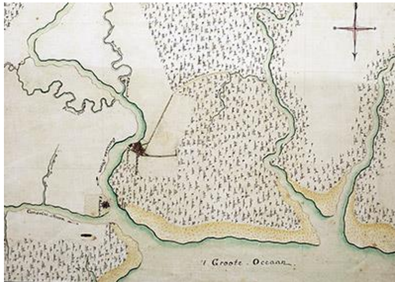
Vluchtroute van Graafland in Suriname

De la Jaille, maar heeft zo een alternatieve etymologie gekregen: 'las(i) ai' betekent in het Sranantongo 'verloren oog'.