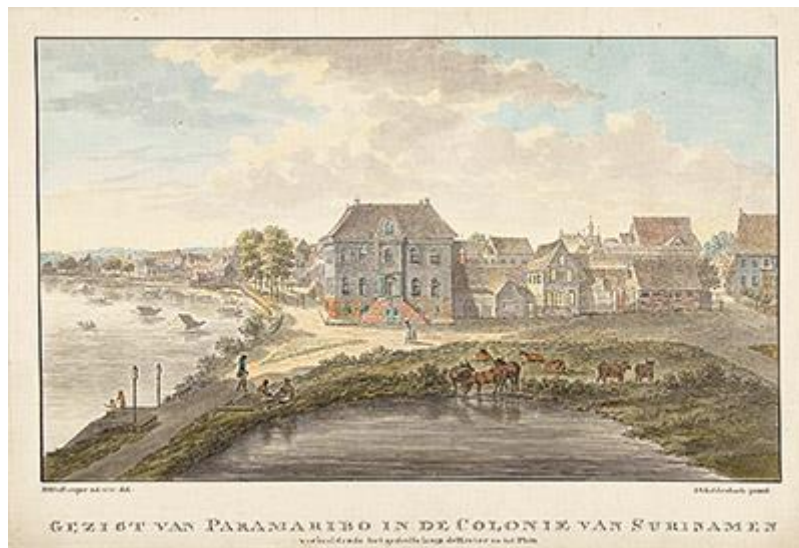
Zicht op 18de-eeuws Paramaribo (collectie Rijksmuseum)