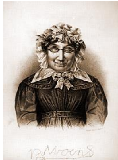
Petronella Moens