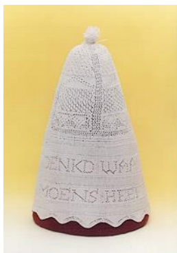
Gebreide slaapmuts (collectie Historisch Museum Deventer)