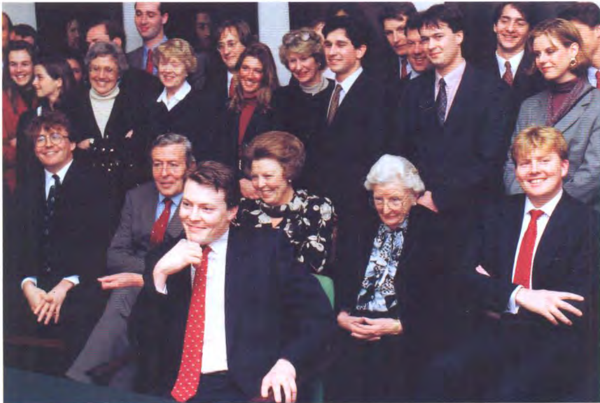
Prins Constantijn studeerde op 1 februari 1995 af.

"Ik moest me dwingen me niet te snel van zulke mensen af te keren. Nu krijgen mensen meer de kans bij mij."